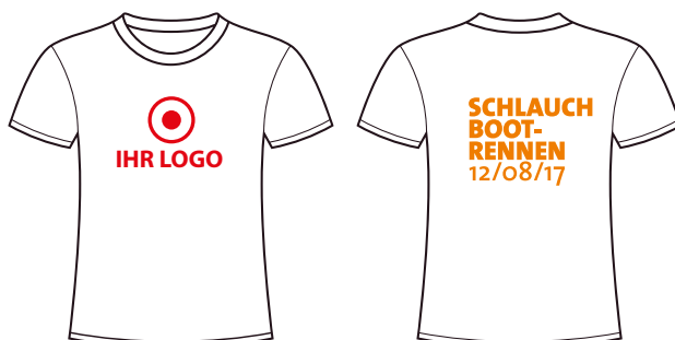
Teilnehmershirt (Vorder- und Rückseite)