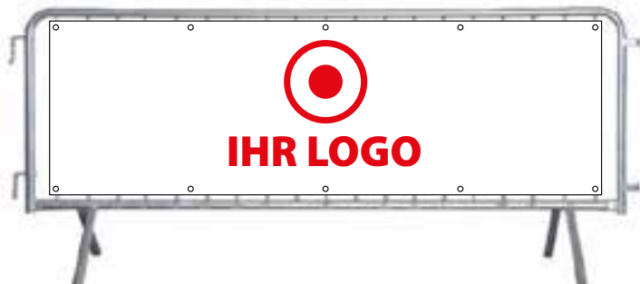
Bande im Zielbereich (200 x 80cm)